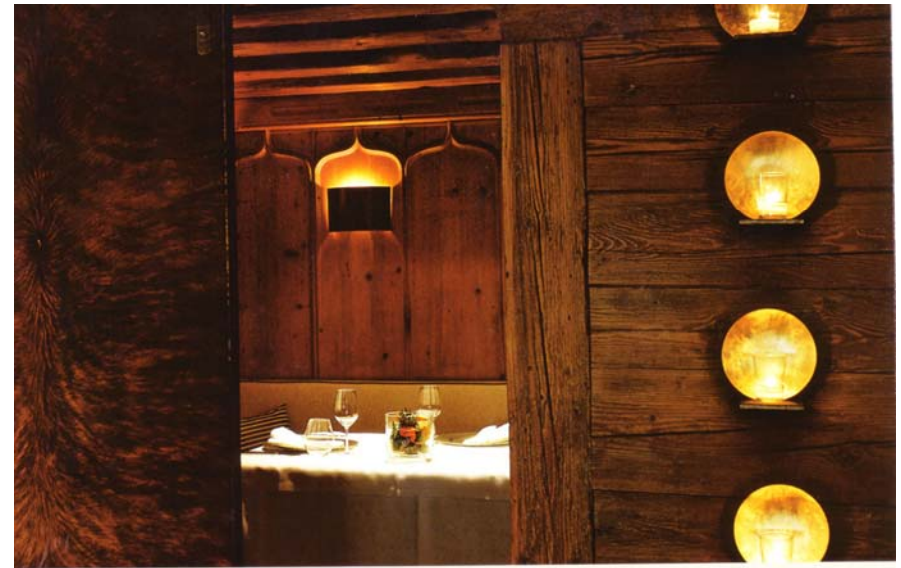
Oben links: Gemütlicher Zeitgeist: das Restaurant Käfer-Schänke im neuen Look | Oben rechts: Eine von 12 individuell gestalteten Stuben